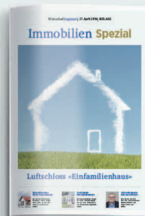
Immobilien 1 3. April 2020