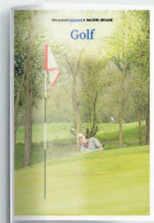
Golf 8. Mai 2020