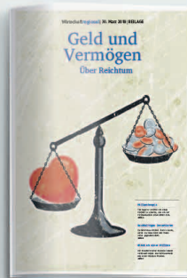
Geld und Vermögen 27. März 2020