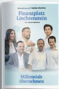
Finanzplatz FL 18. September 2020