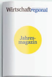
Jahresmagazin 4. Januar 2020