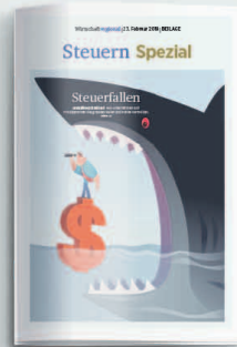
Steuern 14. Februar 2020