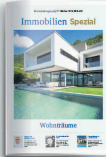
Immobilien 2 23. Oktober 2020