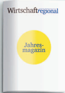
Jahresmagazin 8. Januar 2021

«Wirtschaft regional», die einzige Wirtschaftszeitung für die Region mit breitem Netzwerk und attraktiver Leserschaft beleuchtet die jeweiligen Schwerpunktthemen aus verschiedenen Perspektiven und regionaler Ausrichtung.